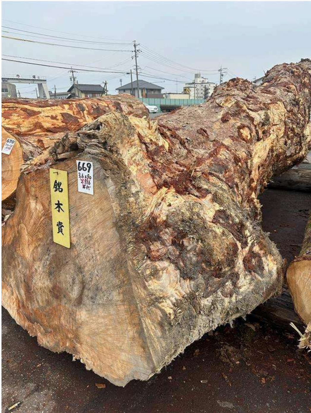
おそらく、他のどんな栃とも違う「瘤空」を期待した一本