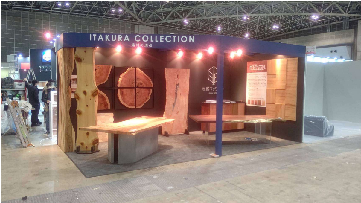
2023年ホテル&レストランショーの出展ブース

こんにちは！板蔵ファクトリーです。旧年中は大変お世話になり、ありがとうございました。 令和6年能登半島地震で被災された皆様に心よりお見舞い申し上げます。また、犠牲になられた方々に、謹んで哀悼の意を表すとともに、被災地の一日も早い復興をお祈り申し上げます。年頭には板蔵ファクトリーとして、社会のためにできる事を考え、行動していきたいという気持ちを社員一同 確認しました。今年もよろしくお願いいたします。