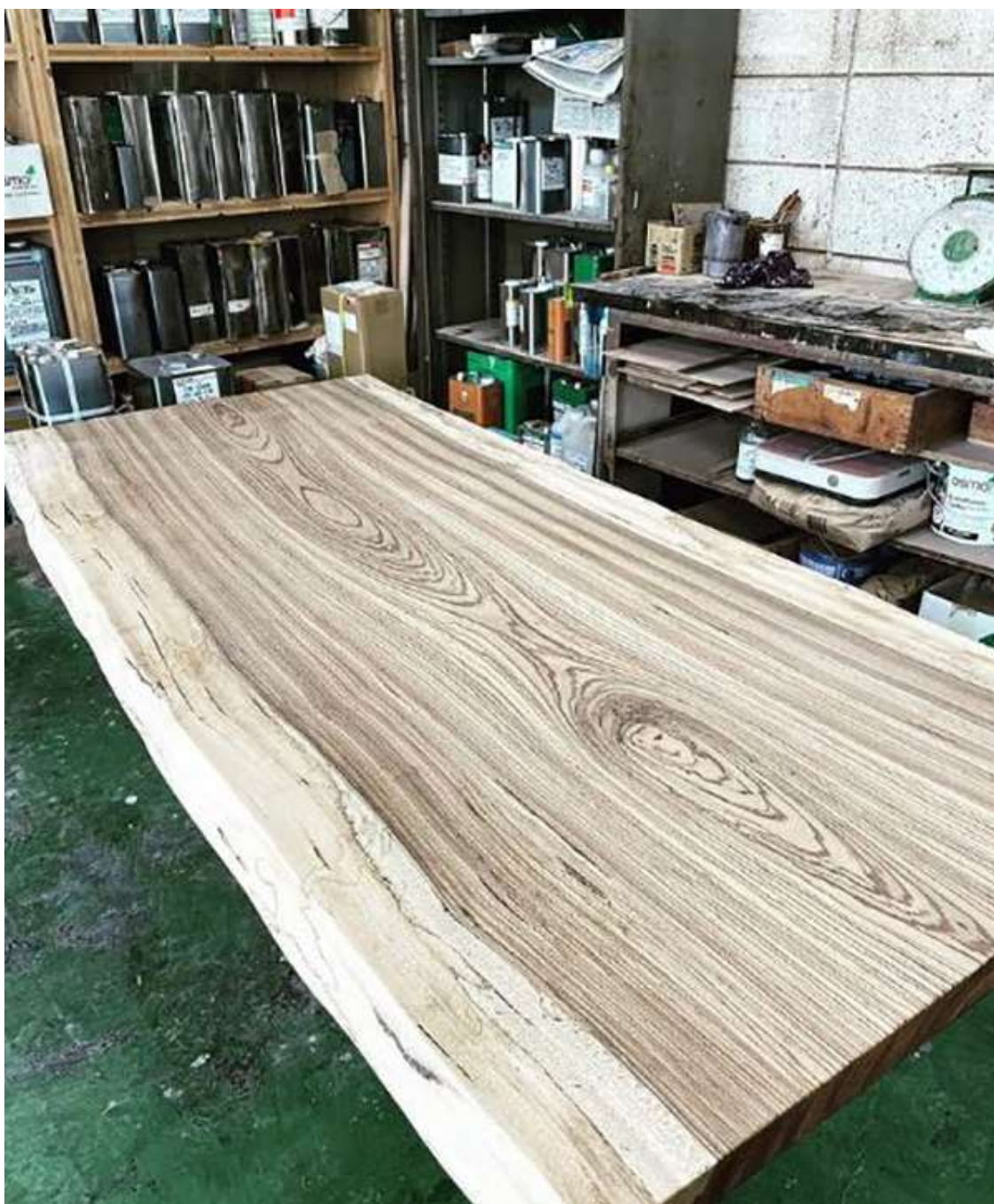
加工中のゼブラウッド。ワシントン条約で輸出が制限される稀少価値の高い木

リスクも少なく、安心して製材できるのです。 一枚板に加工した後も割と狂いなどトラブルが少ない ので安心ですよ。