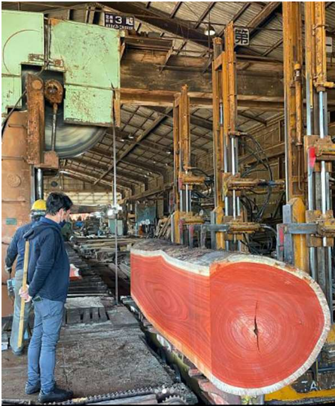
製材途中のパドック丸太。目が覚めるほどの鮮烈レッド。

① その色合いがとても美しいため。製材をした瞬間、レッド、ゴールド、しましま、オレンジ、ブラックなど、それぞれにハッキリ鮮やかな色が目に飛び込んできて、木の美しさをしみじみ感じさせてくれます。