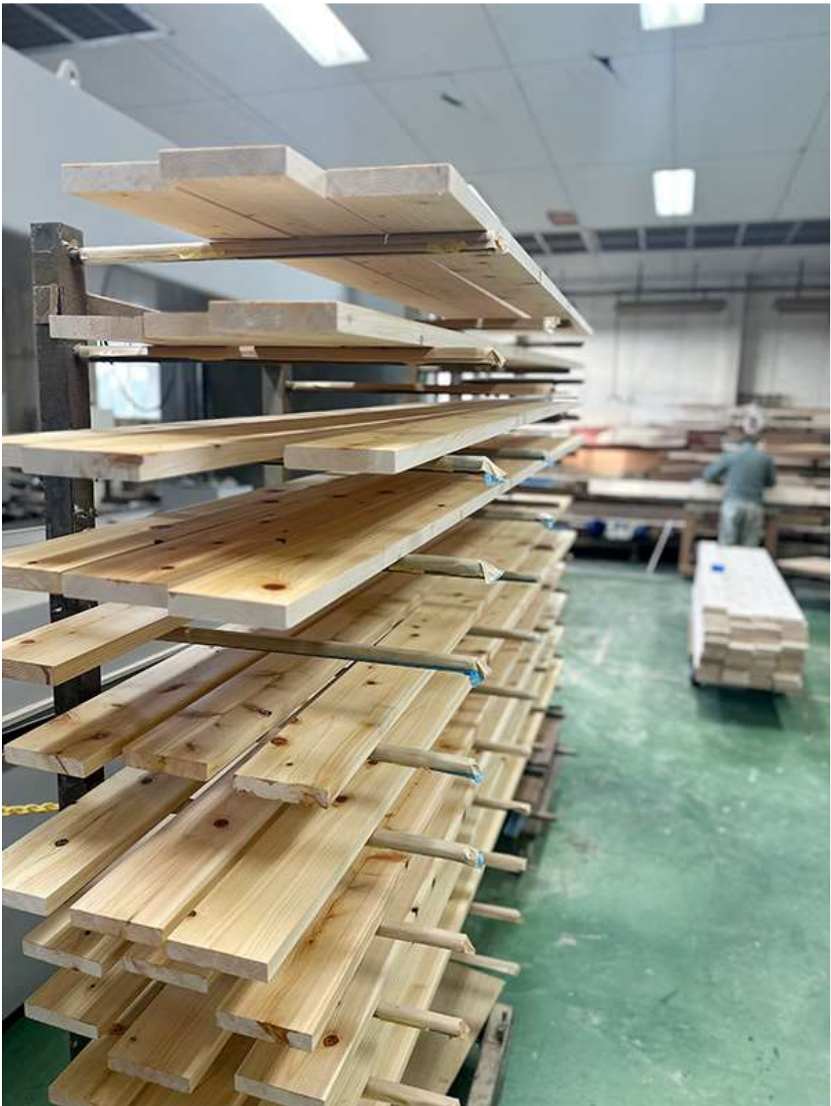
塗装の様子。適度な節が、天然ぽさを感じさせます