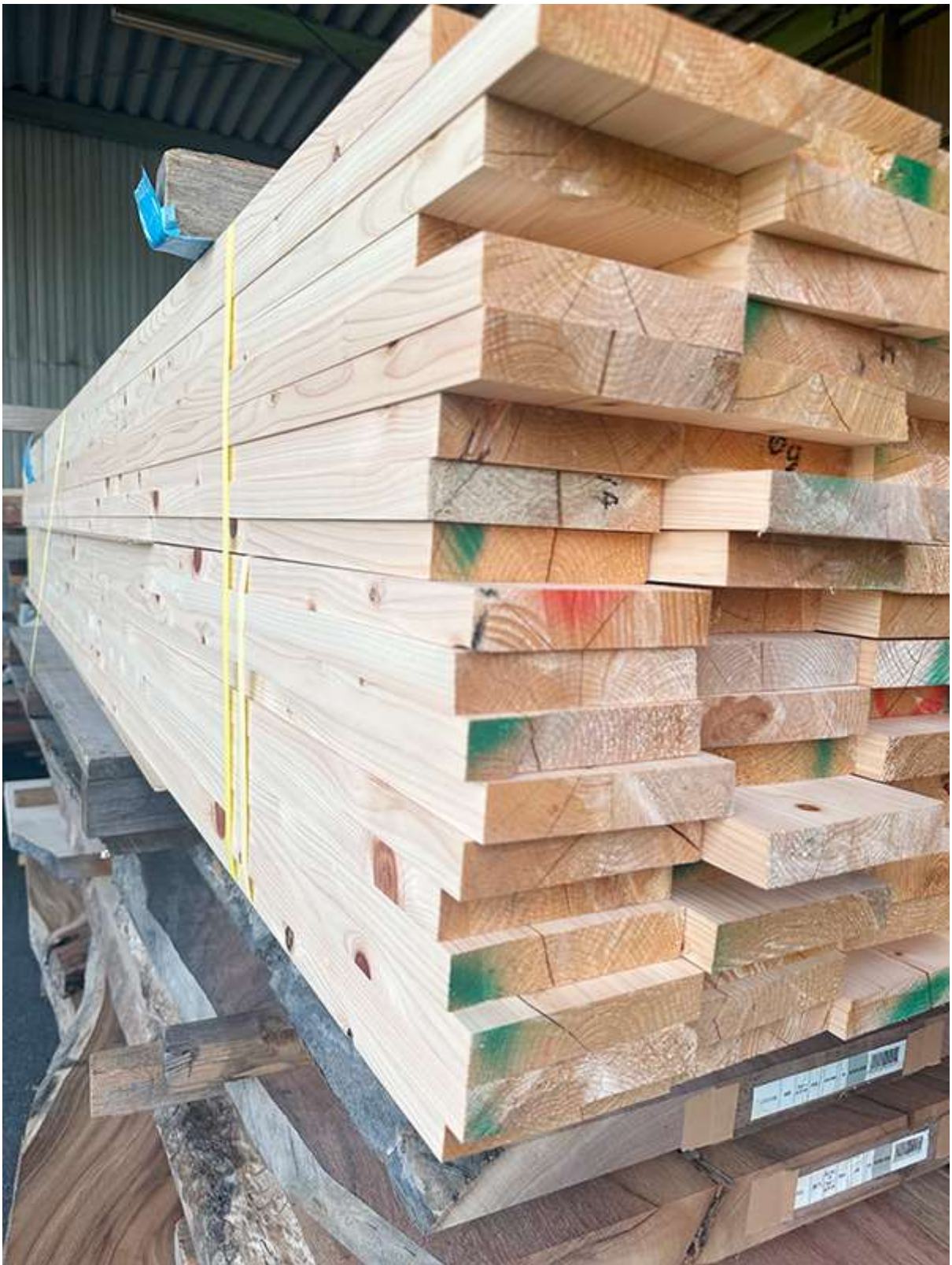
乾燥させてから耳落とし製材をしたところ

製材したての生木の状態から、板蔵倉庫にて3カ月ほど自然乾燥し、人工乾燥をかけ、 じっくりと乾かしました。これが地味だけどとても大事な工程 です。丸太からのものづくりは、もちろん可能ですが半年以上のプロジェクトになりますね。