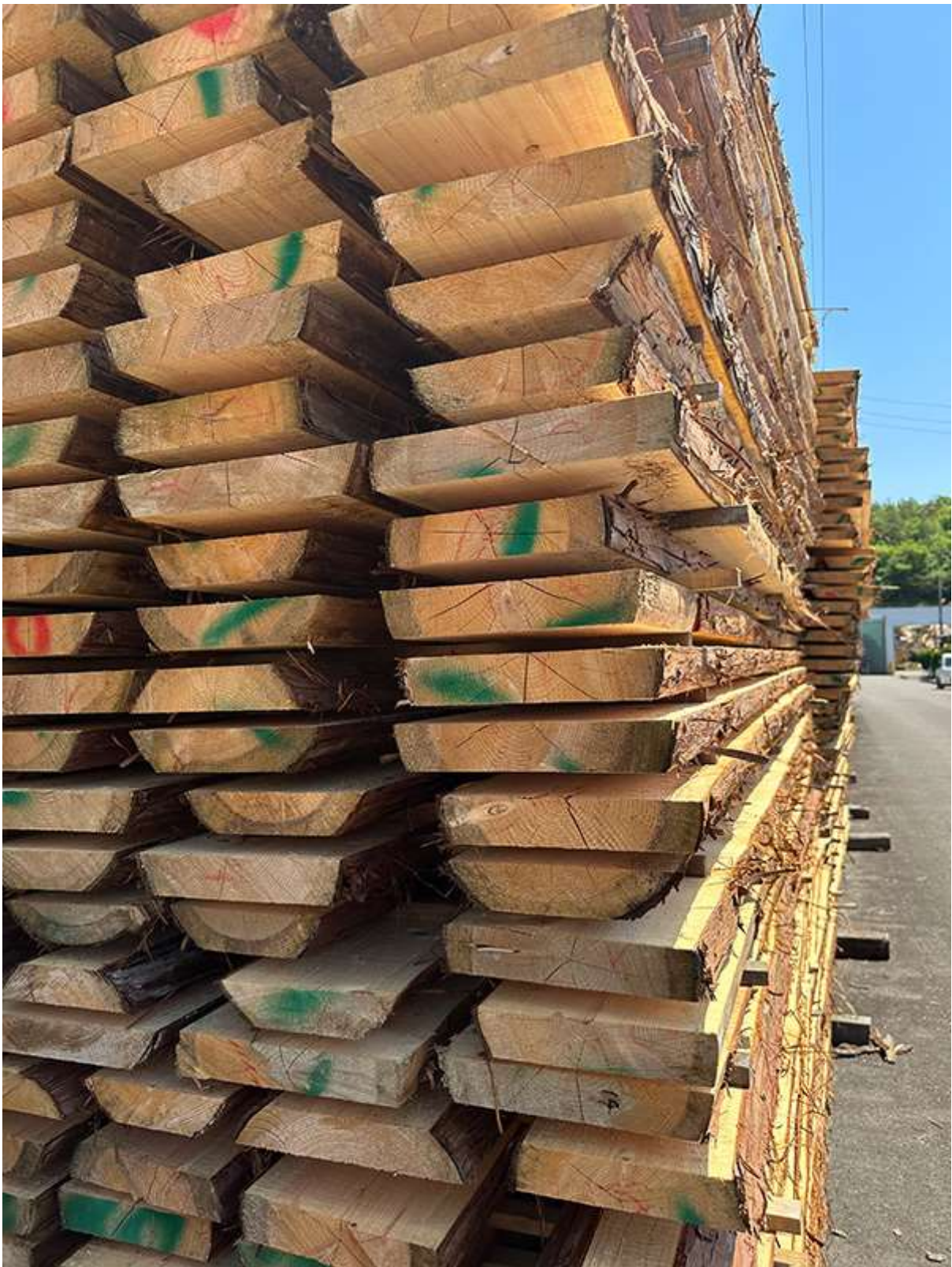
裏木曽エリアの良い産地のヒノキ、製材直後の様子

当初の社内メンバーの熱量に反し…最初の段取りである丸太引き取りの時点で、伐採が遅れたり、雪でトラックが入れず引き取りが伸びたり、年をまたいだり、 何やら予定通りにいかないのが「森あるある」 です。