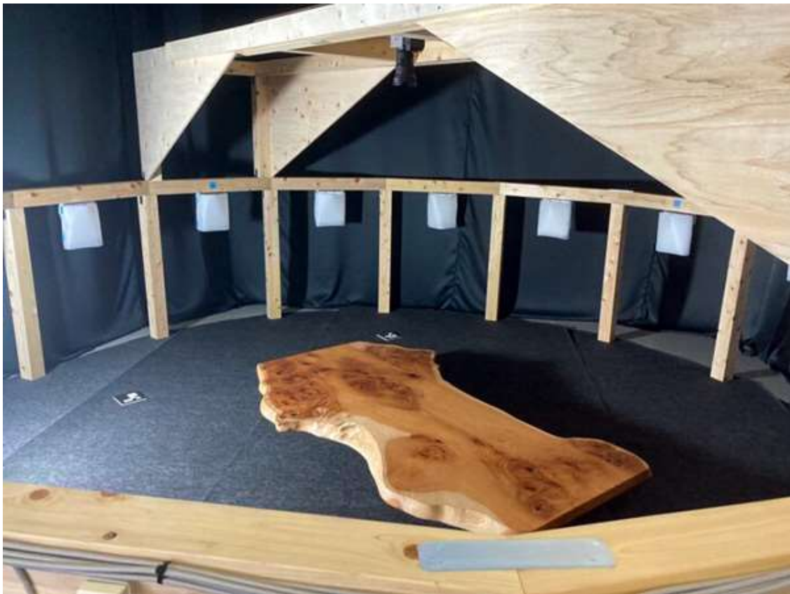
板蔵ファクトリー5階に誕生した、木製円形スタジオ「照」

今回のニュースは、前回の続編です。板蔵ファクトリーで生活技術研究所という学術機関と共同研究している銘木の新しい魅せ方「 照り（テリ） 」についてのプロジェクトです。