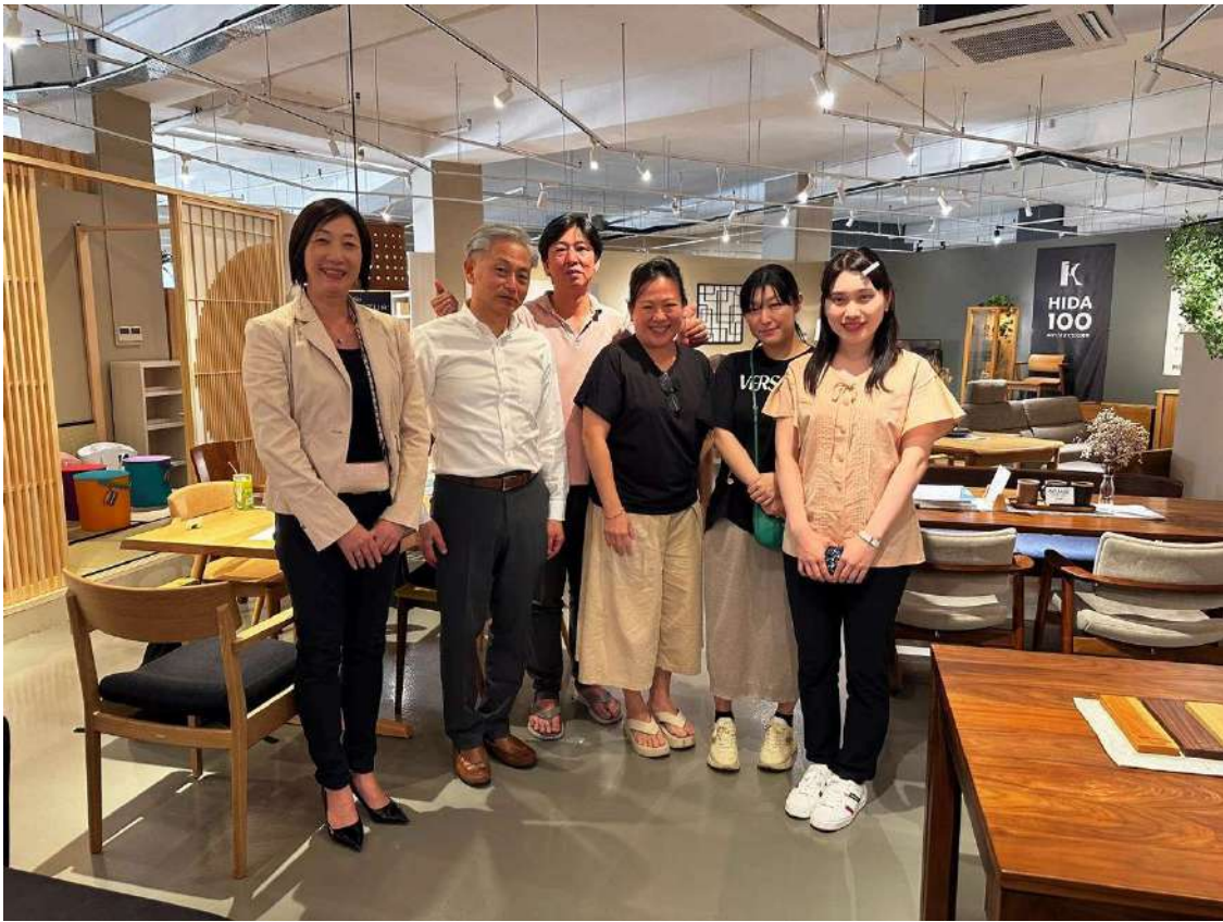
シンガポールで高級日本製家具を扱う事業者と。

日本は寒波の中、シンガポールでは、 体感湿度90%の30度越え 。高温多湿だから無垢が敬遠されるかと思いきや、なんと近年一枚板事業者が多数お店を出店しているとの噂を聞きつけ、家具店実地調査をたくさんしました。複数の店で、東南アジア材や南アメリカ材、一部アフリカ材を中心に濃色の一枚板へ 「〇〇ウォールナット」と名付けて展開 する所が見られるなど、日本との展開の仕方の違いが面白いなあと勉強になりました。「ウォールナット」のブランドイメージは世界共通なののでしょうか。