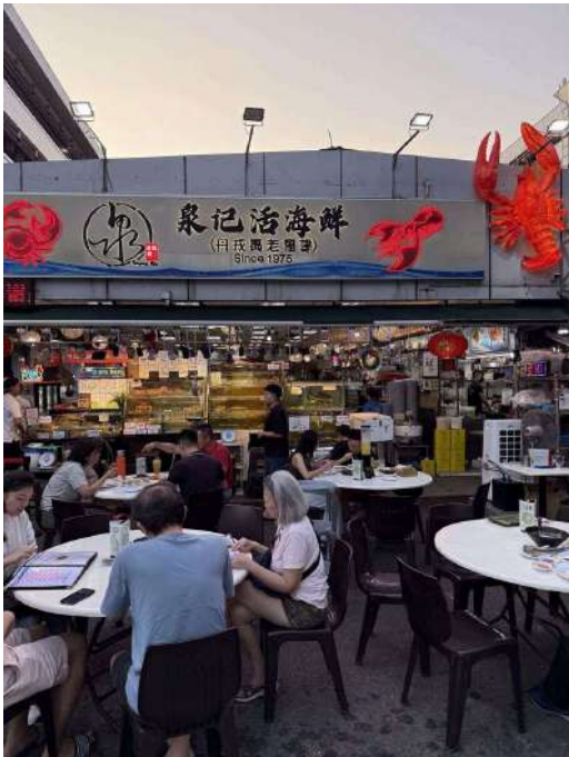
ローカルの方しか知らない絶品海鮮料理のお店

日本は寒波の中、シンガポールでは、 体感湿度90%の30度越え 。高温多湿だから無垢が敬遠されるかと思いきや、なんと近年一枚板事業者が多数お店を出店しているとの噂を聞きつけ、家具店実地調査をたくさんしました。複数の店で、東南アジア材や南アメリカ材、一部アフリカ材を中心に濃色の一枚板へ 「〇〇ウォールナット」と名付けて展開 する所が見られるなど、日本との展開の仕方の違いが面白いなあと勉強になりました。「ウォールナット」のブランドイメージは世界共通なののでしょうか。